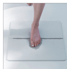
GEM BATH MAT/soil